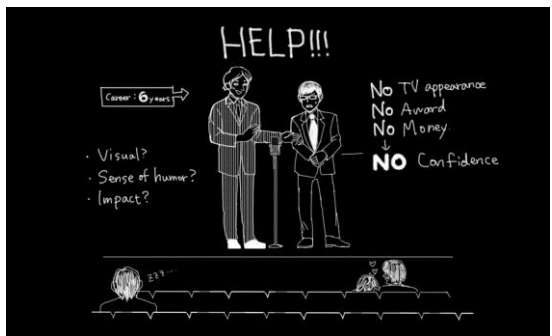
人気になる方法を知りたい(芸人です)

本企画は、60周年を記念し期間限定で実施いたしますが、ADKでは今後も、マーケティングコミュニケーションに携わる広告会社の特性を活かし、新たな価値を創出するCSR/CSV活動を続けてまいります。