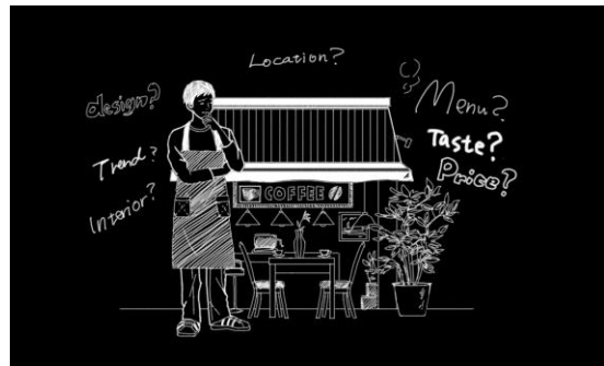
自分の店が流行らない理由を知りたい