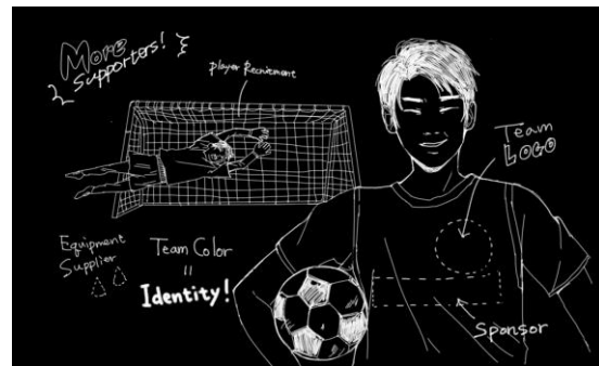
地元のクラブチームの広報プランを一緒に考えて欲しい