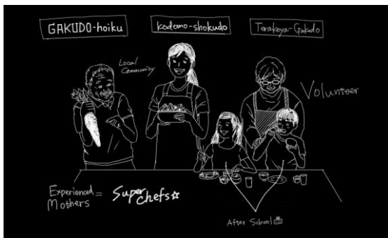
地域住民を巻き込んで地元の学童保育問題を解決したい