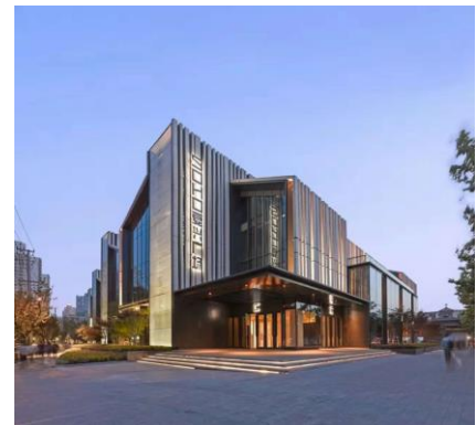
ADK 上旭(上海)网络科技有限公司オフィス

先日、10月23日に中国の巨大 EC モールである京東(ジンドン)が出資する唯一の日本企業、株式会社フランクジャパンに当社が出資したことを発表いたしました。越境 EC におけるフランク社のノウハウや京東との人的ネットワークを活用するだけでなく、自社内に越境 EC 店舗の運営ノウハウを貯め、専任者を配置することで、本格的に中国越境 EC 市場に挑戦していきます。